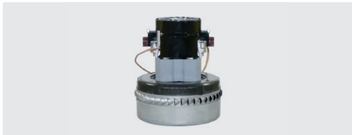
2-stufig. 230 V / 50 Hz. Kabel vorinstalliert