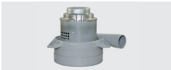
3-stufig mit Abluftrohr. 230 V / 50 Hz. Kabel vorinstalliert