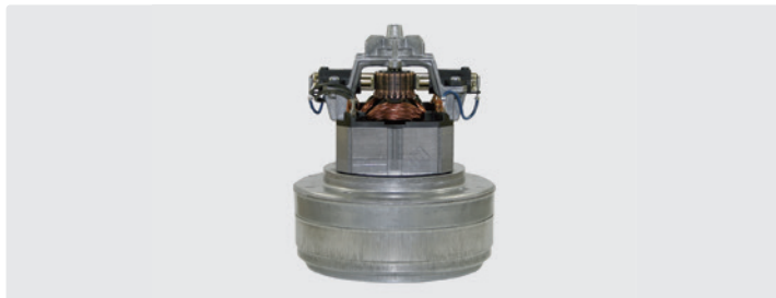
2-stufig. 230 V / 50 Hz. Kabel vorinstalliert