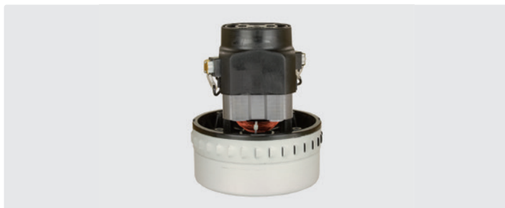
2-stufig. 230 V / 50 Hz. Kabel vorinstalliert