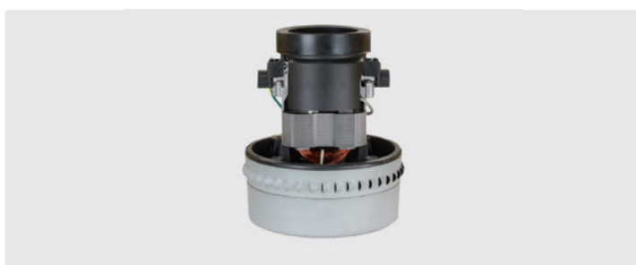
2-stufig. 230 V / 50 Hz. Kabel vorinstalliert