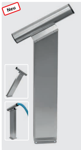
Fugendüsenaufnahme auf Säule für Bodenbefestigung. Edelstahl