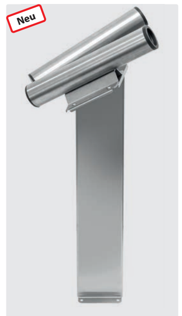
Zweifach-Fugendüsenaufnahme auf Säule, inkl. Adapterplatte. Edelstahl