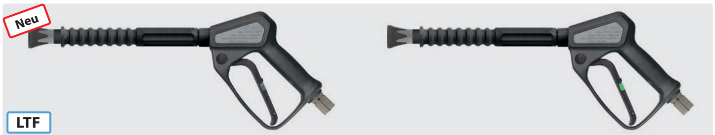
Professionelle Niederdruck Schaumlanze mit patentierter LTF Technik. Pistole ST-2620 mit 300 mm isolierter Lanze und Düsenschutz ST-10 mit Niederdruck-Düse 9040. Max. 125 bar / 80 l/min / 150 °C