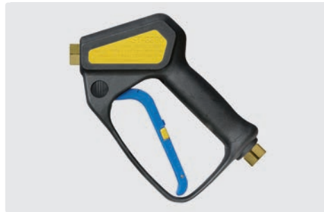
Professionelle Pistole. Weepausführung. Max. 310 bar / 45 l/min / 150 °C