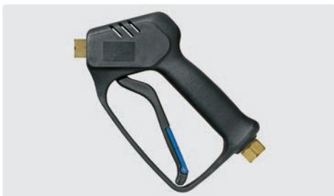
Professionelle Pistole. Weepausführung. Max. 210 bar / 25 l/min / 150 °C