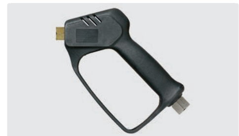
Professionelle Pistole ohne Ventil (Freifluss). Max. 210 bar / 25 l/min / 150 °C