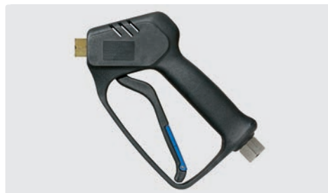
Professionelle Pistole. Weepausführung. Max. 210 bar / 25 l/min / 150 °C