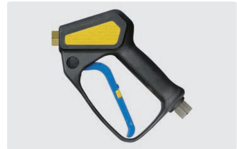
Professionelle Pistole. Weepausführung. Max. 310 bar / 45 l/min / 150 °C