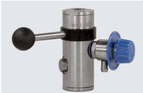
easyfoam365+ Bypass Injektor ST-167 mit Dosierventil ST-161 und Tülle 9 mm