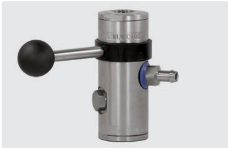
easyfoam365+ Bypass Injektor ST-167 mit Tülle 9 mm