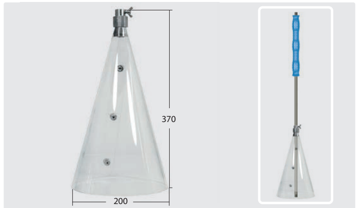
Spritzschutzhäube aus PVC, mit Flügelschraube einstellbare Halterung aus Edelstahl zur Befestigung an Lanzen. Max. 80° C