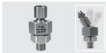
Düsenhalter schwenkbar. Edelstahl. Max. 40 l/min / 90 °C