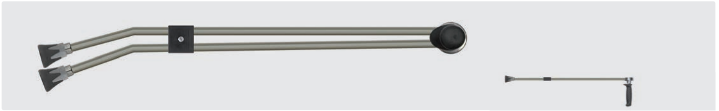
1/4" IG. Strahlrohr mit Ventil ST-54.2 seitlich und Düsenschutz ST-10 mit Niederdruckdüse. Max. 400 bar / 150 °C