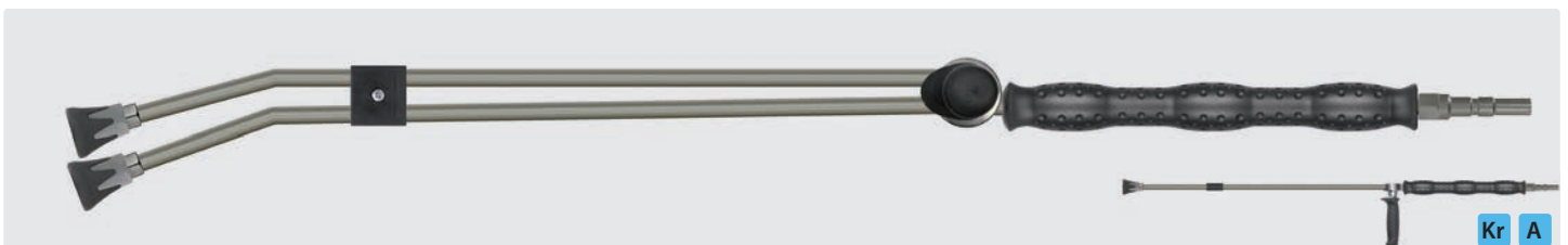
Stecknippel KW. Strahlrohr mit Isolierung ST-29 Cool & Compact, Ventil ST-54.2 seitlich und Düsenschutz ST-10 mit Niederdruckdüse. Max. 400 bar / 150 °C