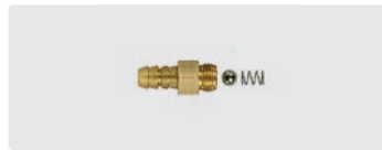
Chemie-Rückschlagventil. Tülle 6 mm