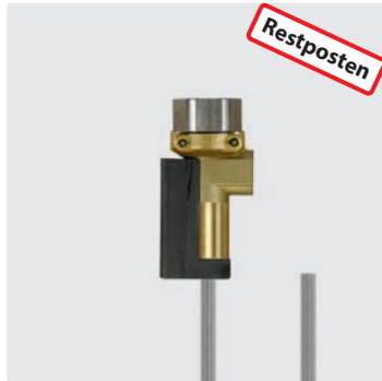
Druckschalter (IP55) mit Kabel 1.200 mm.