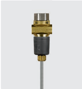
Druckschalter (IP65) 3-adrig mit Kabel 1.200 mm