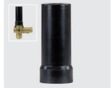
Ventilsperre für ST-261. Nicht für Paneleinbau geeignet.