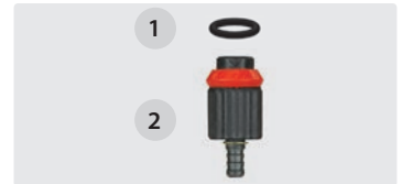
Dosierung, Tülle 6 mm