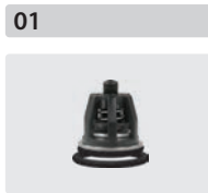
Ventile 6 Stück