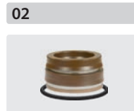
Dichtsätze für 3 Kolben