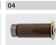
Plungerrohr-Kit für 3 Kolben