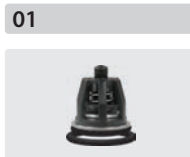
Ventile 6 Stück