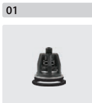
Ventile 6 Stück