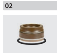
Dichtsätze für 3 Kolben