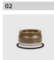
Dichtsätze für 3 Kolben