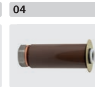
Plungerrohr-Kit für 3 Kolben