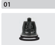
Ventile 6 Stück