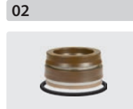
Dichtsätze für 3 Kolben