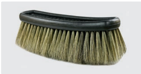
Einsatz. A= 260. B= 230 x 80 mm. Schweineborsten