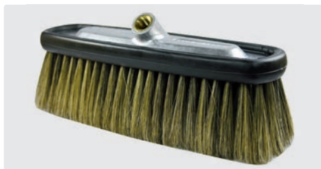
A= 240. B= 230 x 80 mm. Schweineborsten