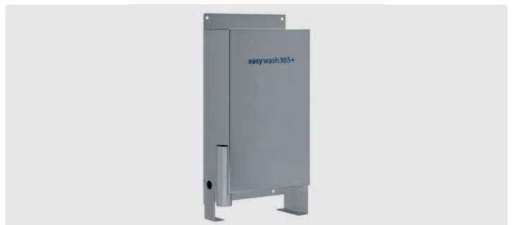
Bürstenbehälter mit Überlauf und seitlichem Abflusstutzen zur Reinigung. Wand- und Bodenmontage. H x B x T = 670 x 340 x 143 mm