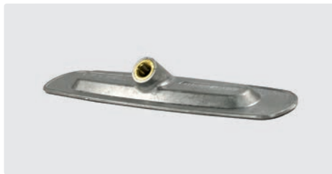
Träger. B= 230 mm. Aluminium