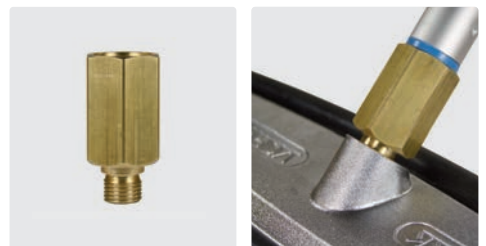
Adapter für Lanzen mit Kordelgewinde. Kordelgewinde : 1/4" AG