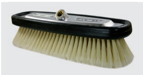
A= 300. B= 300 x 100 mm. Nylon