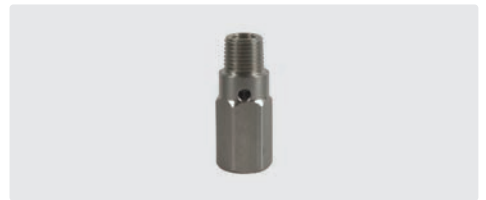
1/4" AG : 1/4" IG. Durchfluss bei 100 bar