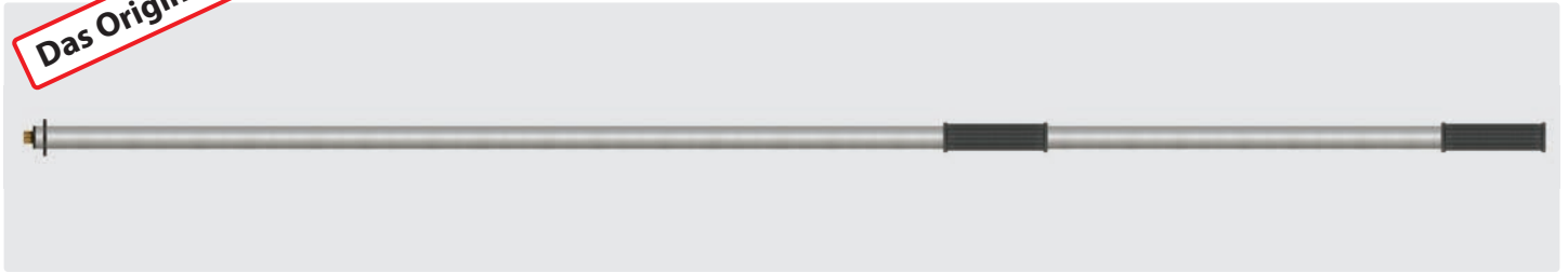
Verlängerungsrohr mit Wasserdurchlauf